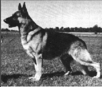
Lance of Fran-Jo