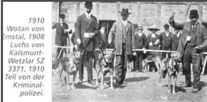
1910 Wotan von Emstal, 1908 Luchs von Kalsmunt- Wetzlar SZ 3371, 1910 Tell von der Kriminal- polizei.

Wurttemberský pes s ovisnutými a sklopenými ušnicami bol síce menej obľúbený, i keď držaním chvosta predstihol aj durínske psy s nepekne stočeným chvostom. Wurttemberské psy boli celkovo väčšie, dobre stavané, so silnejšou kostrou a končatinami. Dokázali predmet pevne uchopiť, ale mali pokojnejšiu povahu ako durínske psy. Aby Švábi, z ktorých sa stali oduševnení šľachtelia, dosiahli požadovaný chovný cieľ, začali šľachtiť durínskeho psa so vzpriamenými ušnicami a peknou vlčou farbou srsti, ktorého neskôr použili pri šľachtení nemeckého ovčiaka dnešného typu. Ani krížením s vlkmi sa nedosiahli uspokojujúce výsledky, takže vlčie miešance nijako neovplyvnili ďalší vývin tohto plemena. Rotmajster von Stephanitz, ktorý bol po celý život veľkým priaznivcom psov, raz na výstave uvidel svojho „vysneného“ psa Hektora Linksreina, neskôr premenovaného na Horanda von Grafrath, ktorý bol spolu s Mari von Grafrath prvý pes zapísaný v nemeckej plemennej knihe.