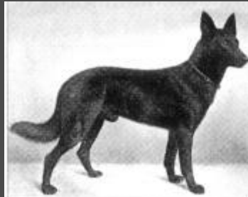
1906/07 Roland von Starcken- burg SZ 1537