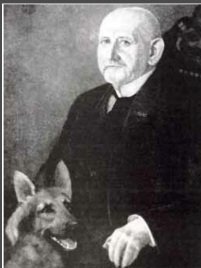
Rittmeister von Stephanitz, der Begründer der Rasse des Deutschen Schäferhundes.

História nemeckého ovčiaka je nerozlučne spojená s menom Max von Stephanitz /1864-1936/. Tento muž sa celý svoj život zaoberal myšlienkou vyšľachtit' ideálneho úžitkového psa, ktorý by sa mohol využiť na viaceré účely. Na základe bohatých skúseností s vojenskými psami iných plemien zistil, že mnohostranné vlohy domáceho pastierskeho psa, by sa mohli využiť na vyšľachtenie nového typu úžitkového psa.